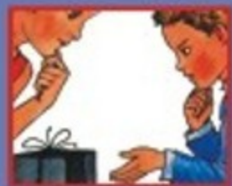
В МАГАЗИНЕ- ПРОДАВЦУ