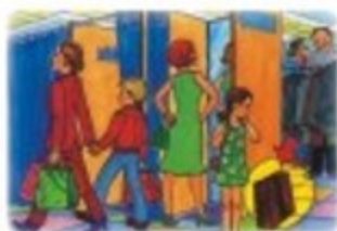
В ОБЩЕСТВЕННЫХ МЕСТАХ