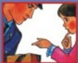
НА УЛИЦЕ ИЛИ В МЕТРО- ПОЛИЦЕЙСКОМУ