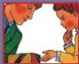
В ТРАНСПОРТЕ- ВОДИТЕЛЮ